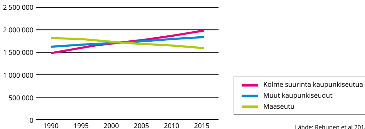
Kaavio 1: Kaupunkiseutujen ja maaseudun väestön muutos 1990–2015

Kaupungistumisen ajurit muuttuvat historiallisesti: Maatalouden koneellistuminen, suurten teollisuuslaitosten perustaminen ja liikenneverkkojen tihentyminen ovat parin sukupolven aikana menettäneet merkitystään muutoksessa (Tommila 1983). Vastaavasti aiemmin marginaalisemmat ilmiöt kuten kansainvälinen muuttovoitto ja kiinteistömarkkinoiden yhä tiiviimpi integroituminen globaaleihin finanssimarkkinoihin vauhdittavat nyt suurkaupungistumista merkittävästi. Vielä ei ole selvää, miten tärkeiksi ilmiöiksi kaupungistumikehityksen kannalta nousevat esimerkiksi ilmastopolitiikan tiukentuminen, liikkumisen kallistuminen tai digitaalisten alustapalveluiden keskittyminen tiheimmin asutetuille alueille.