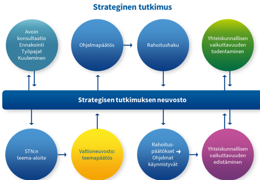
Kuva 1. Strategisen tutkimuksen neuvoston toiminta ja yhteiskunnallisen vaikuttavuuden edistäminen sen osana.

Strategisen tutkimuksen neuvoston (STN) toiminnassa tutkimuksen yhteiskunnallinen vaikuttavuus kulkee punaisena lankana teema-aloitteista rahoitettujen tutkimusohjelmien arviointiin asti. STN tekee vuosittain valtioneuvostolle teema-aloitteen laajoista Suomen yhteiskunnan tulevaisuudelle keskeisistä haasteista. Valtioneuvoston teemapäätöksen jälkeen STN avaa teemoista ohjelmahaut. Ohjelmakokonaisuudella tavoitellaan suurempaa vaikuttavuutta kuin erillisten hankkeiden kokoelmalla on mahdollista saavuttaa. Kun STN valitsee rahoitettavat hankkeet, arviointikriteereinä käytetään tieteellisen laadun ohella yhteiskunnallista merkittävyyttä ja vaikuttavuutta. Rahoituspäätöksiä tehdessään STN myös arvioi, millaisen ohjelmakokonaisuuden hankkeet yhdessä muodostavat. Kullekin ohjelmalle valitaan myös hankkeiden ja ohjelmien välistä koordinaatiota ja yhteistyötä edistävä ohjelmajohtaja. Ohjelmien loppuessa arvioidaan niiden tieteellinen ja yhteiskunnallinen vaikuttavuus.