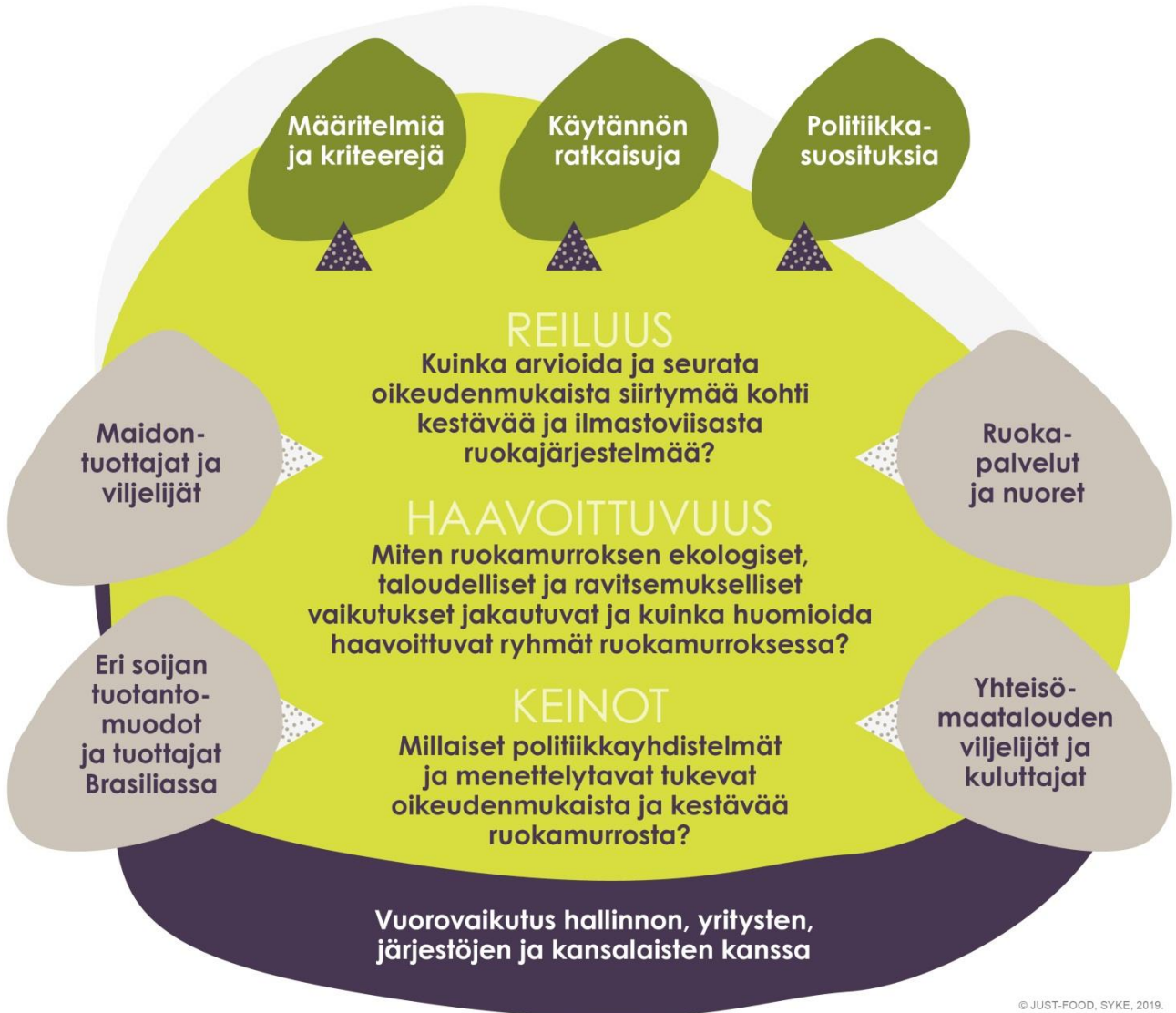
Kuva 1. Reilu ruokamurros -hanketta ohjaavat tutkimuskysymykset, tavoitellut tuotokset ja vuorovaikutuskumppanit.