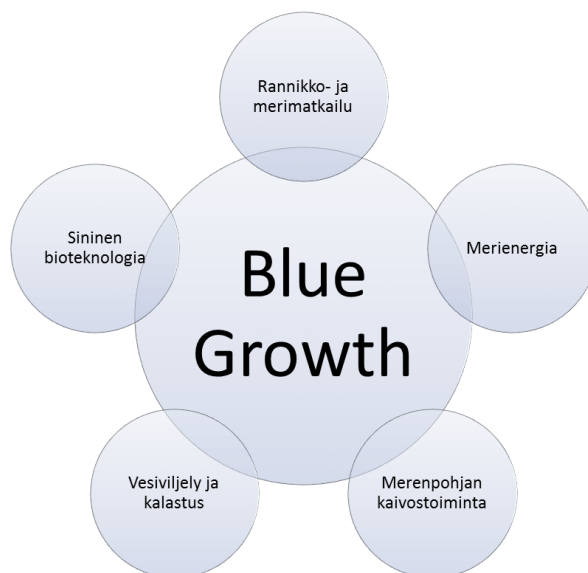
Kuva 1. EU:n määrittämät eniten kasvupotentiaalia sisältävät sinisen kasvun erityisalat(EC, 2012)

Sininen Kasvu tarkoittaa pitkän aikavälin strategiaa, joka tukee merialan kestävä kasvua kokonaisuutena (Kuva 1). Ala nähdään myös merkittävänä innovaatioiden lähteenä kunhan siihen panostetaan riittävästi tutkimusta ja investointeja. Toisaalta lisääntyvä toimeliaisuus merillä vaatii parempaa aluesuunnittelua.