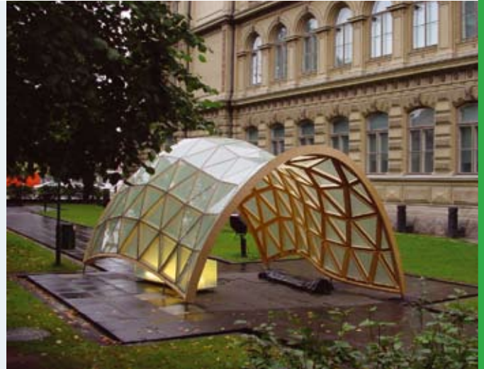
Rakentamisen laadun parantaminen 3D-mittaustekniikan avulla

tojärjestelmän muunteluun, ominaisuuksien parantamiseen tai uusien ominaisuuksien lisäämiseen tai aktiivointiin ohjelmistomuutoksilla tai -täydennyksillä, jotka voidaan toteuttaa tietoverkon kautta. Tieto- ja palveluyhteiskunnan edellyttämät muutokset ja mahdollisuudet jo olemassa olevan rakennetun ympäristön elinkaaren hallinnassa tulevat olemaan rakentamisprosessiakin merkittävämpiä. Tieto- ja viestintäteknikka mahdollistaa rakennusten tuotanto- ja käyttövaiheen tietosisältöjen integroinnin ja sen kautta elinkaariominaisuuksilla tapahtuvan kaupankäynnin.