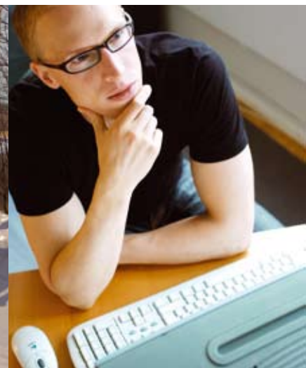
Liikkuvan työkonteen verkottuneen auto- maatiojärjestelmän suunnitteluprosessi

suunnittelun, prosessin sekä ylläpidon toisiinsa tavalla, joka parantaa kokonaisuuden hallintaa. Tietotekniikan avulla suunnittelun laatua sekä nopeutta voidaan parantaa. Virtuaaliprototyypoinnin avulla voidaan testata erilaisia käyttöskenaarioita tarvitsematta turvautua mekaanisiin prototyyppeihin tai pienoismalleihin. Tietoverkko mahdollistaa maantieteellisesti hajautetun suunnittelun. Koneen tai rakennuksen eri osia kuvaavien simulointimallien yhteiskäyttö tietoverkon yli luo uusia mahdollisuuksia, mutta on myös varsin haasteellista.